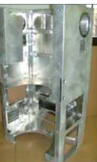
Hegesztő-, fémforgácsoló-, ipari gépész-tanulókat várnak

Ugyanakkor úgy véli, a duális képzés, vagyis a cégeknél töltött gyakorlati idő növelése javíthatja a helyzetet. Igaz, hogy a szakiskolák felszereltsége sokat javult, de egy vállalatnál a diákok sokkal több ismeretot szereznek, nagyobb tudásra tesznek szert, mint a tanintézményekben. Elég csak arra gondolni, hogy egy cég – a vevők igényeit követve – folyamatosan korszerűsíti a gépeit, technológiáját, eszközeit, és ezeket a tanulókat a gyakorlati képzés során mind megismerhetik.