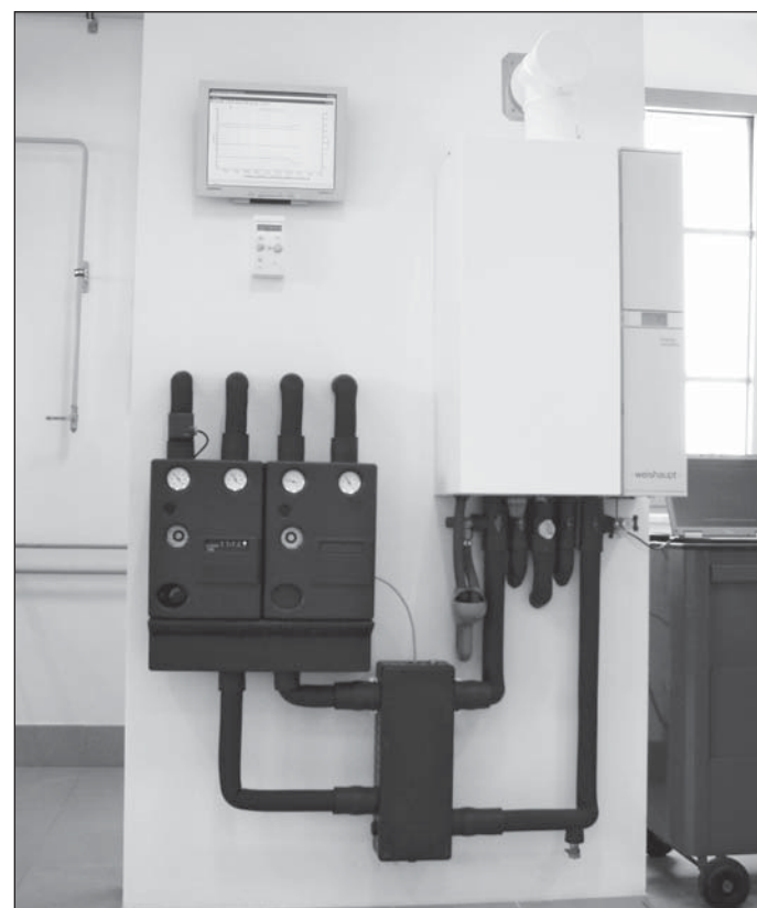
A tüzeléstechnikai cég 1973 óta van Magyarországon