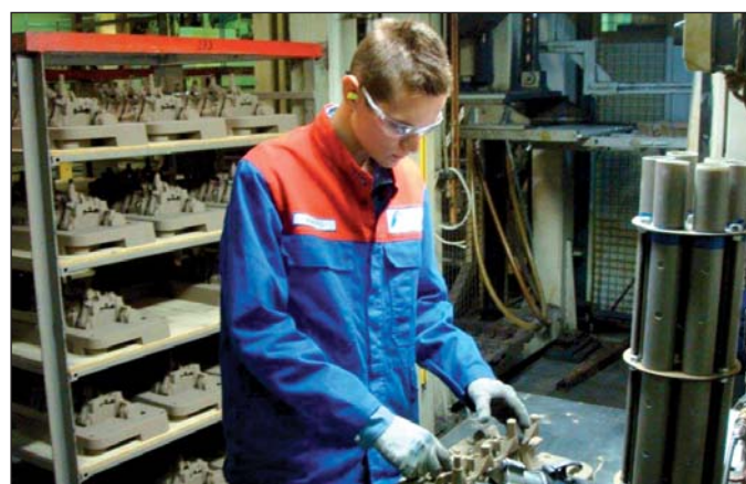
A cégnek is előnyös a tanuló-szerződés

– A szakember utánpótlásnak ez a legjobb módja. Fokozatosan kapcsolódtunk be az oktatásba, a duális képzés a korábbi rendszernél sokkal több lehetőséget kínál – mondta a tanácsadó. – Jelenleg 42 középfokú tanulmányokat végző diákkal van tanuló-szerződésünk, a következő szakmákban: járműipari fémalkatrész-gyártó, forgácsoló, szerszámkészítő, automatikai-, mechatronikai-, gépgyártástechnológiai-, és elektrotechnikus. Ők a tanulmányi időszak nagyobb részét eleve nálunk töltik. Az első évben leteszik a szintvizsgát, majd a második évben már csak a képzés ide-