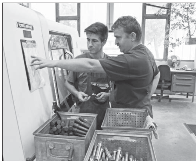
A fiatalok betekintést kapnak a gyártástechnológiába